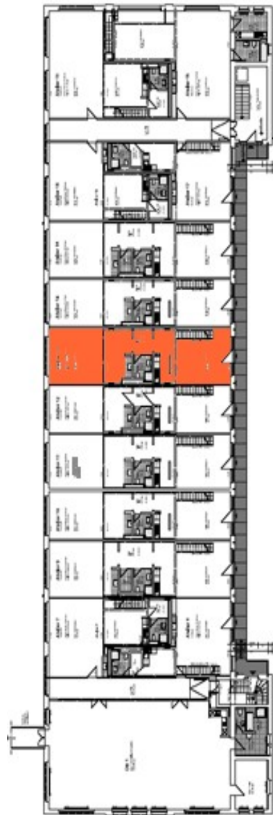
Geschossplan: Obergeschoss mit Lage des Ateliers